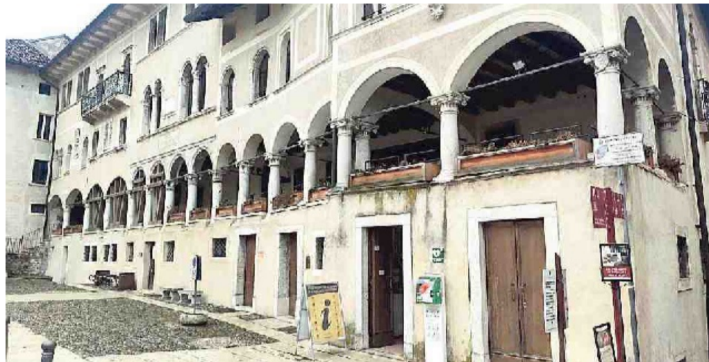
I palazzetti Cingolani in piazza Maggiore. In gennaio partiranno i lavori per l'adeguamento antisismico

All'incirca negli stessi giorni verrà spostata anche la sede dell'ufficio commercio associato dell'Unione montana feltrina con il Suap associato (Sportello unico per le attività produttive), al quale aderisce pure il Comune di Feltre con il suo ufficio attivi-