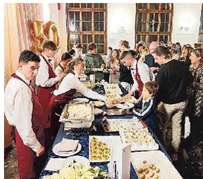
Gli allievi dell'Enaip servono il ricco buffet allestito per l'occasione